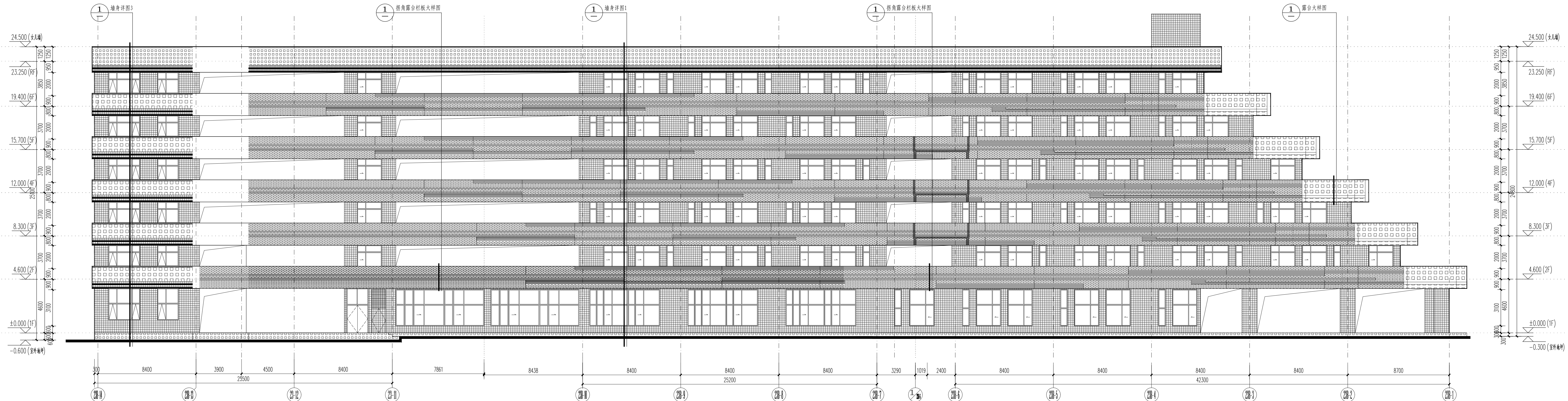
01 23B-14~23B-1轴剖面图 SCALE 1:150

外墙2——米白色柔性质感防水涂料 外墙4——米白色氟碳喷涂铝合金穿孔板 外墙1——深灰色外墙砖 外墙3——深灰色氟碳喷涂铝合金方通百叶